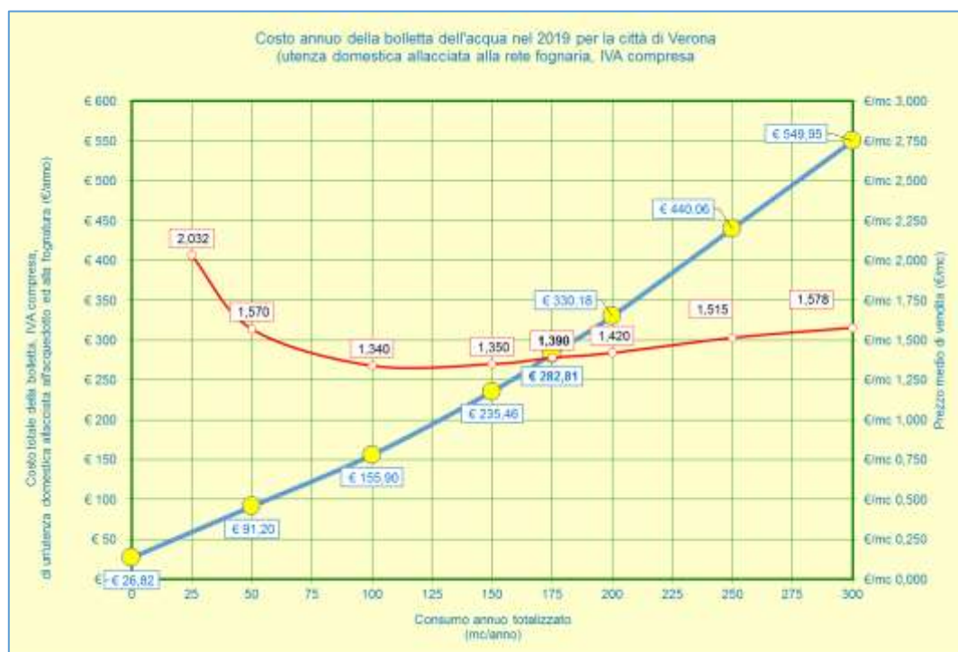
Figura 6 - Costo totale e specifico 2018

In relazione al territorio regionale, le tariffe applicate nella città di Verona danno come risultato il costo totale annuo della bolletta più basso in assoluto, Le tariffe dell'Area del Garda, in linea con le tariffe dell'Area Veronese, rimangono tra le più basse della Regione Veneto.