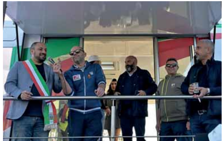
Il Sindaco Dal Cero e l'Assessore Righetti alla manifestazione

grande vetrina per l'inclusione sociale tra sport e divertimento. È stato un modo diverso dal solito per trascorrere del tempo insieme, rispettare le regole e mettersi in gioco sempre e comunque divertendosi con l'attività sportiva. Dalle uscite in canoa, in barca e con le moto d'acqua al basket, le giornate sono trascorse con grande divertimento da parte di tutti i partecipanti. Lo sport è fonte e motore di inclusione sociale. Oltre a insegnare le basi del lavoro di