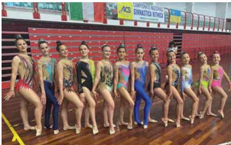
Le ginnaste della Scuola Ritmica al Campionato nazionale

Disciplina sportiva a metà strada tra la ginnastica artistica e la danza, la ginnastica ritmica favorisce uno sviluppo armonioso del corpo