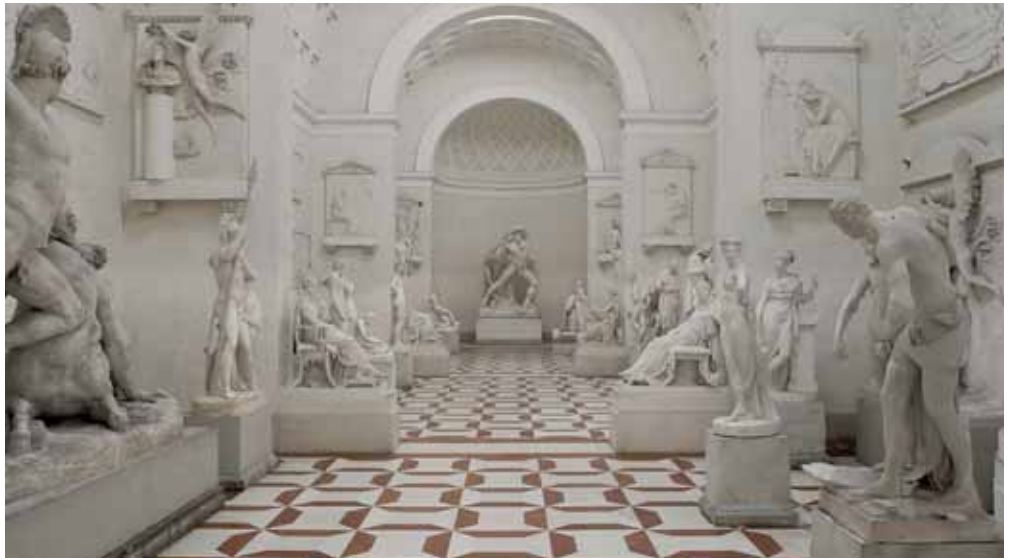
La Sala Ottocentesca nel Museo Gypsotheca Antonio Canova

Il percorso sarà presentato in sala civica Libertà nei prossimi mesi e coinvolgerà le scuole del nostro terri-