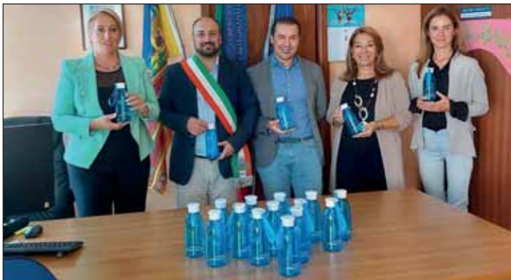
La consegna delle borracce da parte di Air Liquide

Dopo aver installato impianti di microfiltrazione dell'acqua nelle scuole e negli edifici comunali, sono state consegnate ben 1.800 borracce per tutti gli alunni delle scuole: 900 borracce sono state donate dalla ditta Novaresine srl di Lazi-se e 900 dalla ditta Air Liquide Produzione srl di Castelnuovo del Garda. Le borracce sono state distribuite a tutti i bambini, dal nido alla scuola secondaria di primo grado, e contribuiranno a sensibilizzare bambini e famiglie nella necessaria riduzione sia di spreco d'acqua che di consumo della plastica. Lavoriamo tutti insieme per trasmettere i valori della tutela e della conservazione dell'ambiente. Altri progetti seguiranno un percorso che prevederà tante attività per mantenere alta l'attenzione e migliorare il benessere di ogni cittadino.