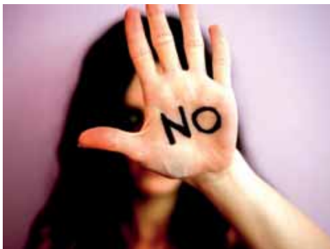
Combattiamo la violenza sulle donne

Sono una quindicina le volontarie che hanno offerto la loro disponibilità come operatrici per questo prezioso servizio. In questi mesi hanno partecipato ad attività di formazione specifi-