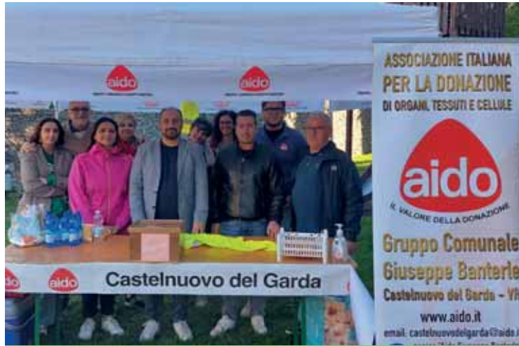
La partecipazione di Aido alla Festa dei nonni

è sabato 10 dicembre, con luogo ancora da definirsi, per la presentazione del progetto sul libro del volontariato. Nel corso dell'incontro andremo a presentare il risultato di un anno di lavoro che ha visto impegnata la nostra associazione insieme agli amici di Fidas.