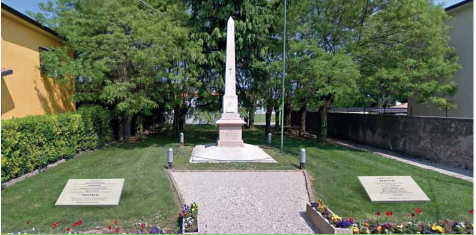
Il rendering con le due lapidi posizionate ai lati del monumento ai Caduti