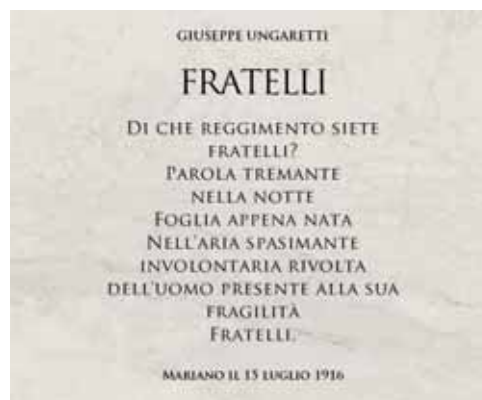
Le iscrizioni sulle due lapidi

Grande Guerra del Gruppo Alpini di Castelnuovo del Garda, hanno portato alla luce questa triste storia.