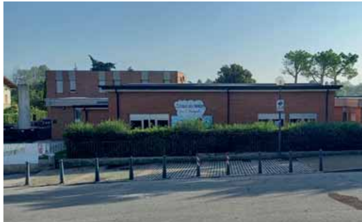
La scuola dell'infanzia Don Manganotti di Cavalcaselle

«Abbiamo terminato da poco un intervento di ristrutturazione della copertura, verificando anche la vulnerabilità sismi-