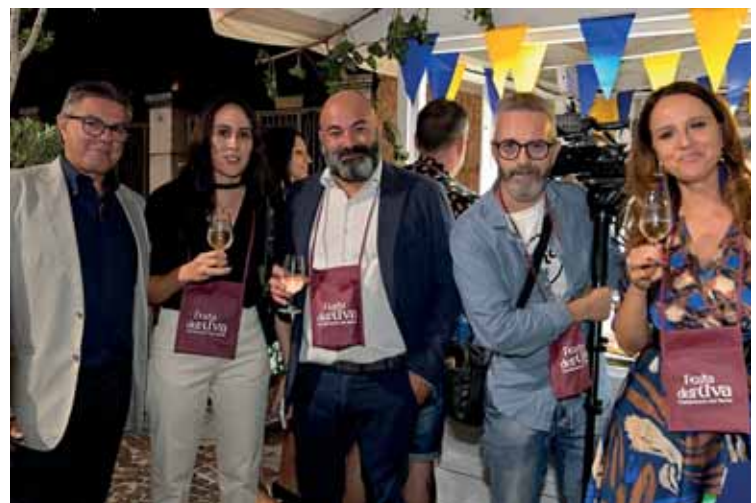
La Festa dell'Uva con il ritorno nelle strade del centro