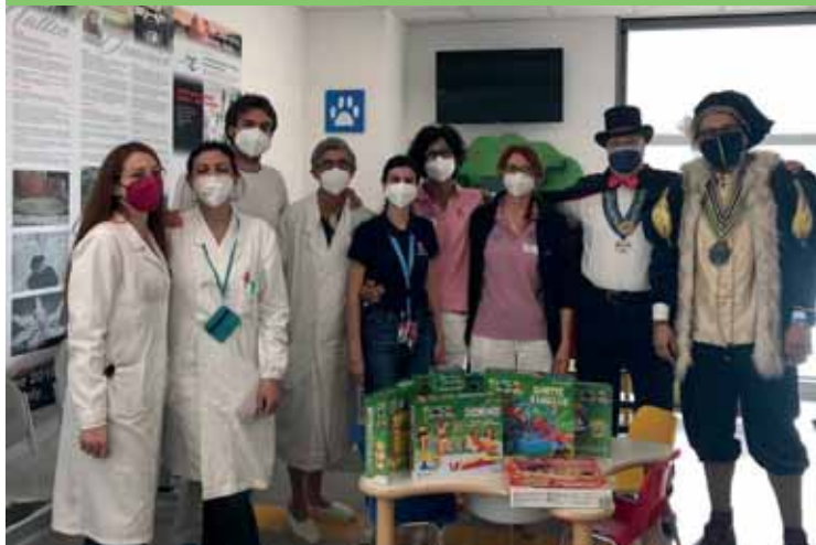
La consegna dei giochi ad Abeo all'ospedale di Borgo Trento

Storo (Tn), quindi siamo stati ospiti del Carnevale di Rosolina (Ro) e a luglio della Pro loco di Bersone (Tn), per