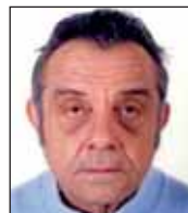
Maurizio Costanzo anni 70 26 febbraio 2022