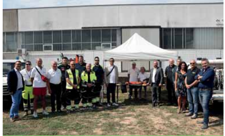
Lo stand della Squadra volontari di Castelnuovo del Garda

La giornata è proseguita con la visita agli spazi espositivi allestiti dalle diverse squadre e focalizzati sulle differenti e