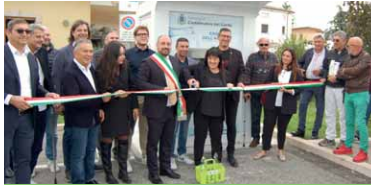
L'inaugurazione della casetta dell'acqua

La casetta utilizza un processo di microfiltrazione dell'acqua, mentre una speciale lampada a raggi ultravioletti sottopone a disinfezione l'acqua prima dell'erogazione. Questo particolare sistema consente di distruggere il dna dei batteri senza l'utilizzo di sostanze chimi-