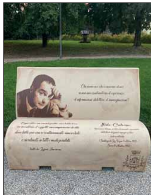
Le tre panchine letterarie, suggestivi elementi di arredo urbano, collocate al Brolo delle Melanie