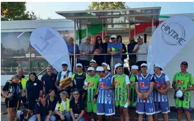
Alcuni momenti dell'evento al lido Campanello

squadra, la bellezza dello stare insieme, la necessità di rispettare le piccole regole quotidiane, lo sport promuove una maggiore conoscenza di sé e dell'altro. E quando inclusivo, lo sport è l'antidoto più forte che abbiamo a disposizione per vincere qualsiasi tipo di discriminazione. Un grande lavoro di squadra tra il Comune di Castelnuovo del Garda, Pro loco , Asd 1° Maggio su Coraggio , Asd Sangio Wolves Basket , Asd Garda Paddle , Fidas Castelnuovo