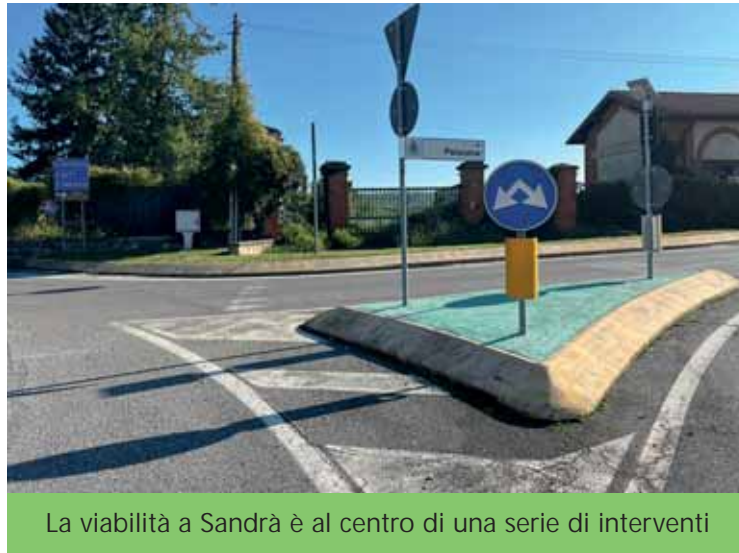
La viabilità a Sandra è al centro di una serie di interventi

È stato possibile spiegare nel dettaglio alcuni interventi rilevanti che miglioreranno la percorribilità nelle frazioni e presentare pro-