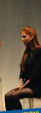
TEATRO FUORI ROTTA