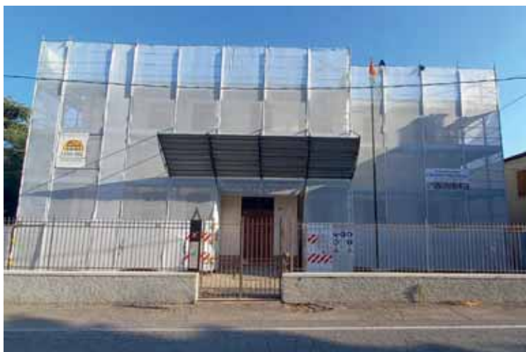
Lavori in corso all'ex scuola di Oliosio, ora sede espositiva

Lavori in corso all'ex scuola elementare di Oliosio. Gli interventi consistono nel rifacimento della copertura, sistemazione delle facciate e del sistema di smaltimento delle acque meteoriche, tinteggiatura delle pareti e dei soffitti delle aule interne, per una spesa complessiva di 74.000 euro. Una manutenzione straordinaria motivata dalla necessità di salvaguardare un immobile che tanto ha significato per gli abitanti della frazione.