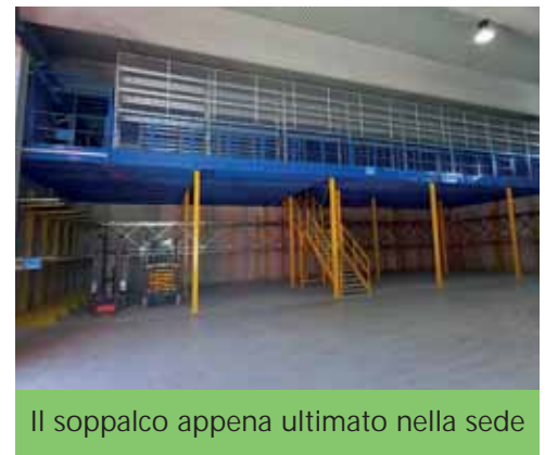
Il soppalco appena ultimato nella sede

Chiunque può iscriversi alla nostra associazione, uomini e donne, basta essere maggiorenni e aver voglia di dare aiuto alla comunità grazie alle proprie competenze.