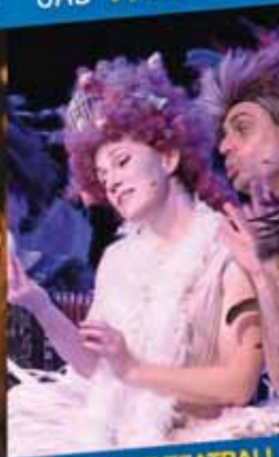
PEM HABITAT TEATRALI