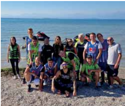
L'evento "Con noi il lago è speciale"

Nella seconda parte dell'anno abbiamo visto impiegati i nostri volontari in moltissime attività di formazione, supporto ad eventi ciclistici o podistici, servizi antincendio e nel periodo estivo una squadra è stata impegnata tutte le domeniche in località Campa-