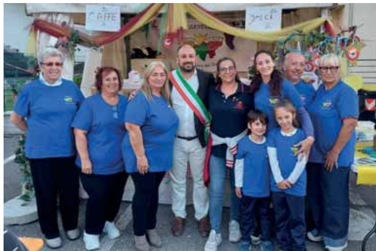
L'associazione La Duchessa del Moro con la presidente Fidas

La novità è nata per dar vita a una collaborazione con una nuova associazione, "La Duchessa del Moro" Carnevale di Castelnuovo, nata nei mesi scorsi e alla quale Fidas Castelnuovo ha voluto dare la possibilità di raccogliere fondi per poter cre-