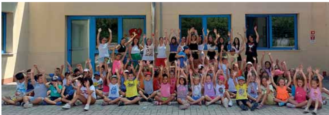
Un saluto dal gruppo del Centro estivo: arrivederci all'anno prossimo!

L'estate, si sa, per i bambini è sinonimo di divertimento e spensieratezza dopo le fatiche della scuola e quest'anno, chiusa la lunga parentesi della pandemia, il Cer è tornato nella sua veste migliore per donare ai più piccoli la serenità che mancava da tempo. Liberi dalle fastidiose ma necessarie restrizioni che hanno inevitabilmente viziato le precedenti estati, quest'anno i bambini sono tornati a vivere un'avventura condivisa ed entusiasmante, all'insegna di quella socialità educativa che da sempre contraddistingue l'atmosfera del Cer. In questo viaggio lungo sei settimane i bambini hanno conosciuto cinque strani eroi: l'instancabile folletto Jo, il lupetto coraggioso Nuk, Pompon, un buffo cagnolino a sei zampe, e la strana coppia formata dalla volpe-samurai Maurice e da Vera, un affascinante panda rosso; con le loro mirabolanti avventure, questi simpatici personaggi hanno insegnato ai bambini l'importanza di credere nei propri sogni e la bellezza di poter contare sugli amici nei