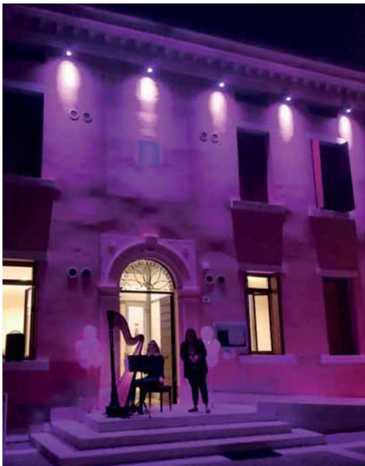
Il municipio in rosa per la prevenzione del tumore al seno

Ad oggi il Comune di Castelnuovo del Garda conta 52 dipendenti, ben 8 in più rispetto al 2019.