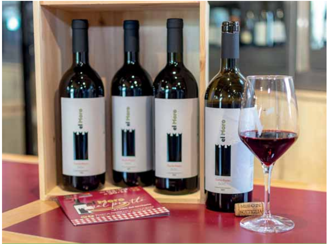
El Moro, un Garda Rosso Doc protagonista delle originali ricette dei nostri ristoratori