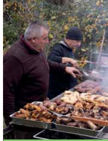
Grande grigliata in Fiera

al lavoro e si prepara per un'altra importante manifestazione per il territorio: l' Antica Fiera di Cavalcaselle , che, come da tradizione, si terrà il terzo weekend di novembre, ossia da venerdì 18 a lunedì 21. Nata come fiera degli asini, la Fiera, che si tiene sul colle San Lorenzo dove è presente la chiesetta della Madonna degli Angeli, simbolo della frazione di Cavalcaselle, nel tempo ha unito agli aspetti agricoli quelli più folkloristici e goliardici legati ai bivacchi. Com'è ormai consuetudine,