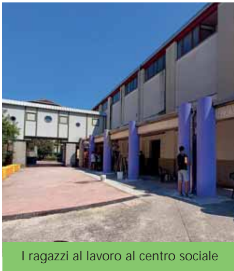
I ragazzi al lavoro al centro sociale

Sempre il martedì, dalle 18.15 alle 20, sarà aperto Al Centro, un centro gio-