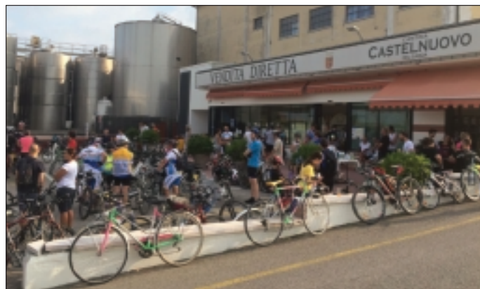
Un momento della bicicletta dello scorso anno

La bicicletta attraverserà le colline ed i vigneti di Castelnuovo e permetterà ai partecipanti di conoscere alcune attività produttive del territorio e di assaggiare, lungo il percorso, alcuni prodotti locali, quali miele e formaggi.