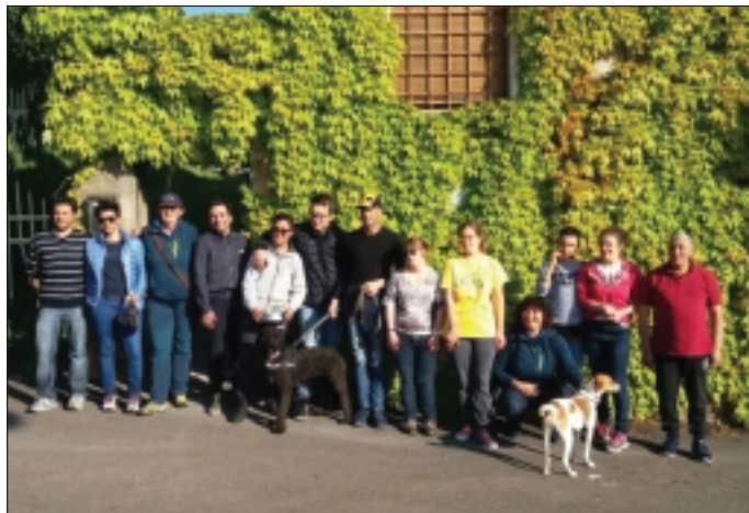
Il gruppo dei partecipanti al percorso formativo

Il progetto per la prima volta ha coinvolto due realtà comunali, Castelnuovo del Garda e Lazise, che non solo hanno contribuito economicamente alla sua realizzazione, ma hanno lavorato in sinergia condividendo obiettivi e mettendo a disposizione risorse umane, con il coordinamento dei servizi socio-educativi. Molte sono infatti le persone che hanno interagito in questa esperienza