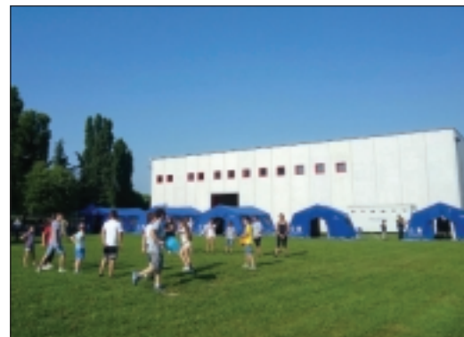
A sinistra, alcune fasi dei lavori intorno alla sede; a destra, un'esercitazione con i ragazzi nel campo allestito per l'occasione

Un sincero apprezzamento per l'ottimo lavoro svolto e per il risparmio economico dovuto alla modalità di intervento scelta dai volontari. Non che ce ne fosse bisogno, ma questa è un'ulteriore conferma di quanto siano preziosi i nostri volontari.