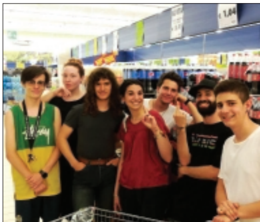
I ragazzi che partecipano alle attività del Centro durante un'uscita e nella sede della ex scuola elementare

Il gruppo, eterogeneo per età e per caratteristiche di personalità, crea una grande ricchezza di scambio reciproco: i ragazzi si ascoltano, si rispettano e si mettono in gioco. Alcune attività di quest'anno hanno focalizzato l'attenzione sull'introspezione.