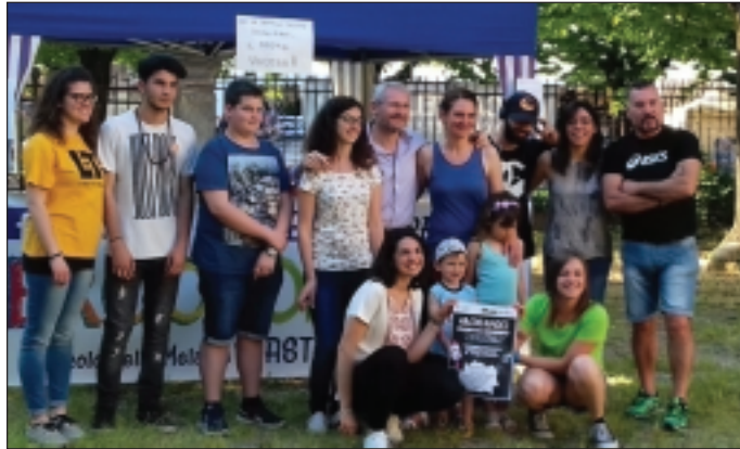
Un momento della festa organizzata per il progetto ABC

Una breve carrellata delle attività proposte permette di percepire il valore sociale dell'evento, una fotografia di una parte di preziose risorse, spesso ignorate o date per scontate: