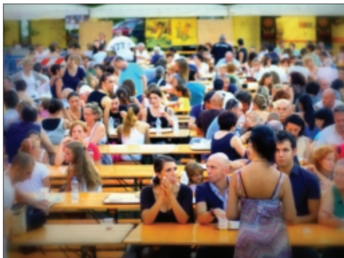
L'edizione dell'anno scorso di Sport in Piazza

«Con l'obiettivo di avvicinare i giovani allo sport, riproponiamo con piacere una quattro