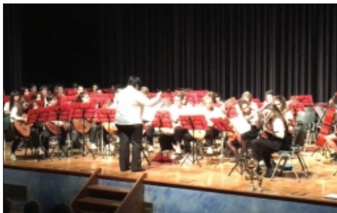
Un momento dello spettacolo dei ragazzi dell'indirizzo musicale

In occasione del concorso "Scuole in musica" che si è