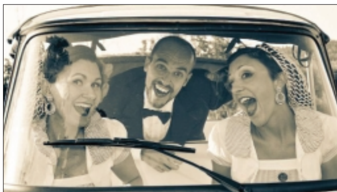
Il Trio Marrano, protagonista il 6 luglio in Corte Castelletti

La rassegna prosegue il 6 luglio a Corte Castelletti, in via Belfiore 6 a Cavalcaselle. Qui il Trio Marrano presenterà Swing italiano degli anni Quaranta . Il Trio Marrano, accompagnato dal Quartetto Bellimbusti, mira a riproporre i grandi successi del repertorio