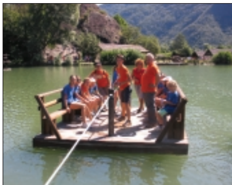
Nei centri estivi il divertimento non manca

Attive anche parrocchie e associazioni. La parrocchia di Castelnuovo propone il grest per i ragazzi dalla terza primaria alla prima secondaria di secondo grado dal 3 al 21 luglio. Lunedì, mercoledì e giovedì dalle 8.45 alle 12.15 attività in sede; martedì uscita in piscina e venerdì gita dalle 9 alle 18. La parrocchia di Sandrà organizza il grest al centro parrocchiale per i ragazzi della scuola primaria e secondaria di primo grado. Si svolgerà dal 3 al 28 luglio, dal lunedì al venerdì, dalle 8 alle 13 con una-due uscite settimanali sino alle 17.30. La parrocchia di Cavalcaselle propone il grest per i ragazzi dalla terza primaria alla terza secondaria di primo grado al centro parrocchiale e al parco di villa Sacro Cuore di Cavalcaselle. Sarà dal 3 al