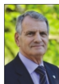
Luciano Di Murro Arredo urbano, Castelnuovo d'Italia, Gemellaggi, Piccole manutenzioni, Segnaletica lunedì 10 - 11 mercoledì 10 - 12