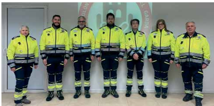
Il nuovo direttivo della Squadra Volontari ODV