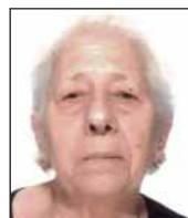
Seria Paja anni 77 15 giugno 2022