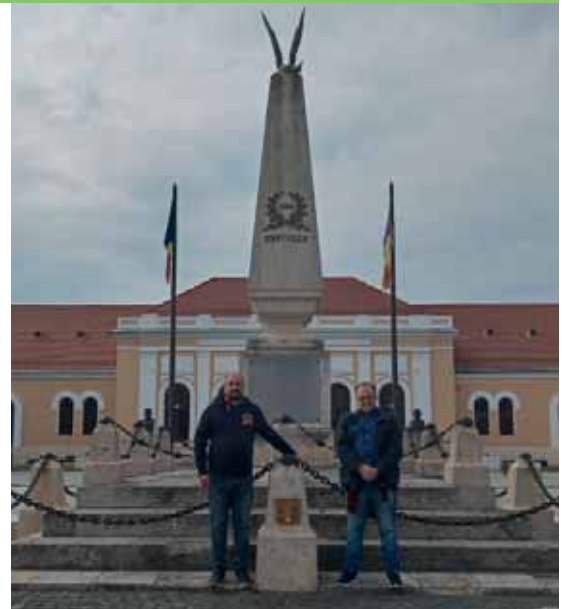
Il monumento ad Alba Iulia dedicato a Custozza

L'associazione Motii Tara de Piatra e il Comune di Zlatna hanno proposto invece il "Laboratorio nella natura" e la "Cena con ingredienti locali". Gli ospiti hanno dapprima