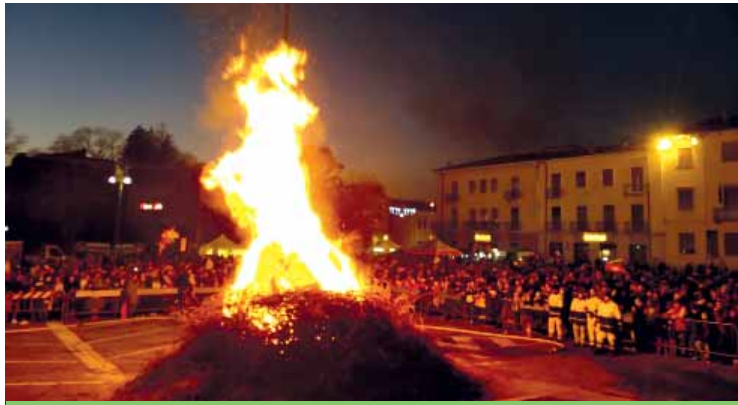
L'edizione 2019 del falò della befana, prima della pandemia

sepio Vivente degli antichi mestieri (17-18 dicembre 2022) promosso dalla scuola dell'infanzia "Don G. Manganotti" di Cavalcaselle con stand enogastronomici e mercatino.