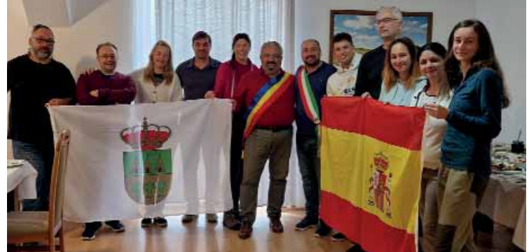
Momenti di confronto fra Amministrazioni lontane ma con molti interessi comuni

Prosegue l'itinerario gastronomico del progetto europeo The Food Club, che vede capofila il Comune di Castelnuovo del Garda.