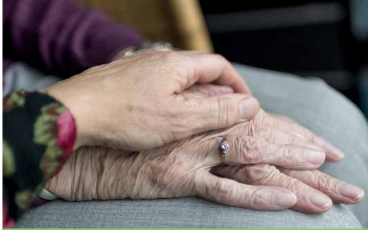
Centro sollievo, un aiuto per affrontare i casi di demenza

Il centro sollievo, ad accesso gratuito, sarà aperto un pomeriggio la settimana. A cadenza quindicinale verrà inoltre attivato un gruppo di auto mutuo aiuto rivolto