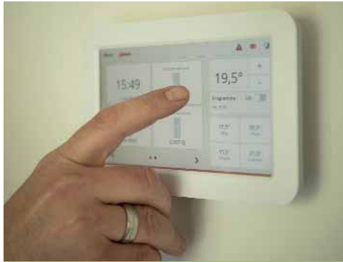
Energia: per il Comune costi raddoppiati

Ora, con l'estinzione anticipata dei mutui, eliminiamo dai bilanci 2023 e 2024 le rate che impattano interamente sulla spesa corrente, sia per la parte capitale che per gli interessi, per un ammontare di circa 160.000 euro l'anno. Il risparmio ci aiuterà a far fronte per i prossimi due esercizi all'incremento delle spese per l'energia che l'Ente dovrà prevedibilmente sostenere. Questa estinzione anticipata non è