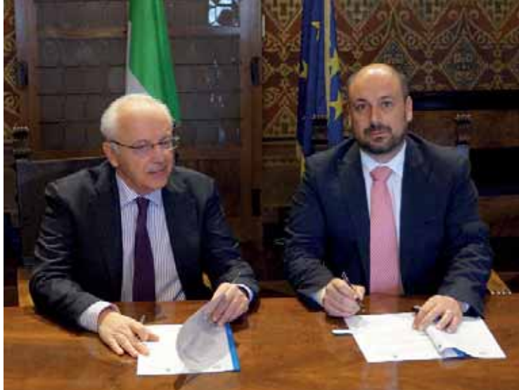
La firma del protocollo d'intesa in Prefettura

La firma fa seguito alla presentazione del progetto per la sicurezza urbana presentato dal Comune che ha ottenuto un finanziamento di quasi 13.000 euro da parte del Ministero dell'Interno. Il contributo verrà impiegato in attività di prevenzione e contrasto dello spaccio di sostanze stupefacenti. A tale proposito, gli agenti della Polizia locale sono stati impegnati in un corso di formazione specialistica.