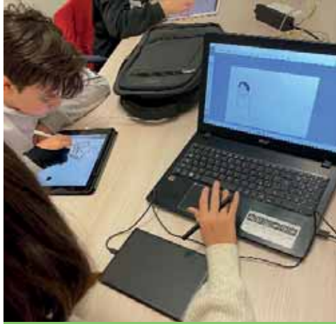
Ragazzi al corso di disegno digitale

Il 28 dicembre è in programma una speciale giornata dedicata ai ragazzi dai 14 ai 18 anni con un'uscita alla palestra Hyperspace di San Giovanni Lupatoto. Per informazioni scrivere a