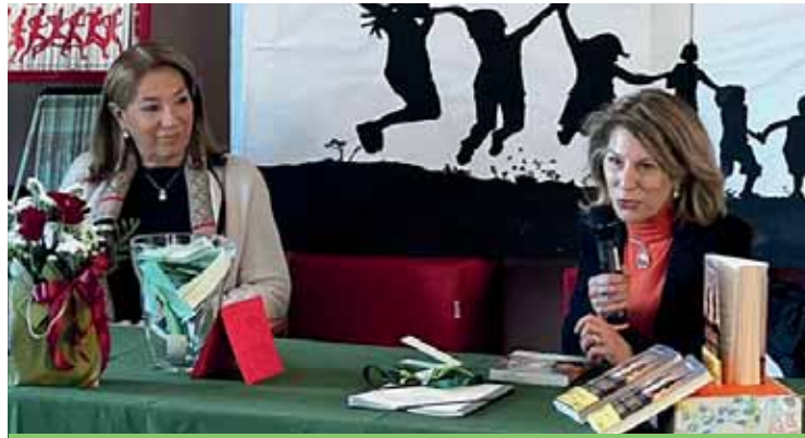
Antonella Sbuelz all'incontro con gli alunni a Cavalcaselle

La scrittrice si era resa disponibile per un incontro con gli studenti del nostro Istituto comprensivo e il 23 novembre al teatro comunale ha incontrato gli alunni