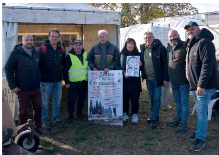
Fiera di Cavalcaselle, una manifestazione che non invecchia

Sempre al centro parrocchiale, sabato si sono svol-