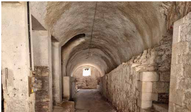
Forte Cavalcaselle, un pezzo di storia da riscoprire

lità di raggiungere in caso di necessità i 550 soldati) con un armamento di 11 cannoni, 6 obici e 2 mortai.