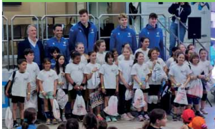
Il gruppo minivolley premiato con i giocatori della Serie A

delle nostre atlete che in questo modo hanno segnato la strada per un roseo futuro. Per la prossima stagione sportiva avremo ragazze che parteciperanno a tutti i Campionati giovanili, dall'Under 12 all'Under 18. Ma non ci fermiamo: già il 29 e 30 luglio abbiamo in programma il Torneo di Green Volley agli impianti sportivi comunali, e con metà agosto si ricomincerà a lavorare per prepararci al meglio per la stagione sportiva 2023/2024 trasferendo-