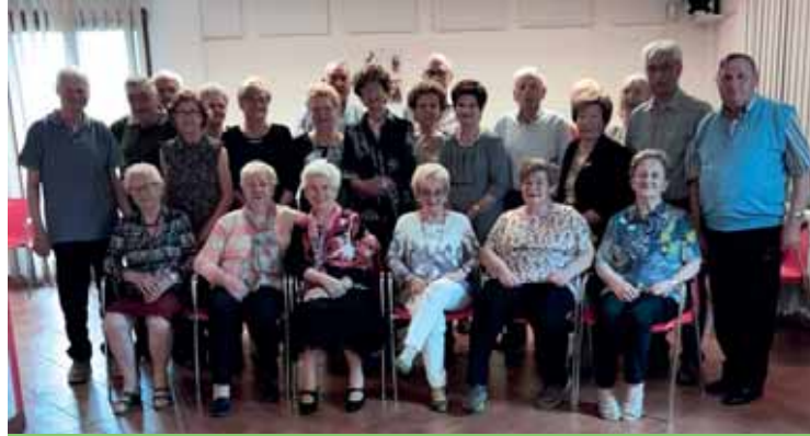
L'affiatato gruppo dei Pomeriggi danzanti

Angonara. Continuano gli incontri dell'Angonara di Castelnuovo, un pomeriggio di socializzazione per chi vuole stare insieme,