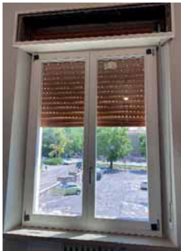
Nuove finestre in biblioteca

Uguale risultato nella ex scuola elementare di Oliosi, dove l'intervento ha sanato una situazione ormai gravemente compromessa, e lo spazio espositivo avrà dunque un ulteriore elemento di qualifica.