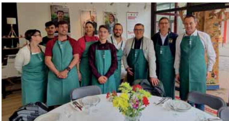
Cucinare insieme favorisce la conoscenza e l'amicizia

Il giorno seguente siamo stati accompagnati in Place du Marché Neuf, un mercato ben organizzato, dove puntualmente vengono allestite bancarelle con prodotti gastronomici di ogni Paese, in modo che ogni cittadino possa mantenere un forte legame con i sapori della propria terra. Successivamente abbiamo visitato una biblioteca, con testi in varie lingue e tipologie e un intero settore dedicato a libri di cucina, suddivisi per i Comuni aderenti al progetto euro-