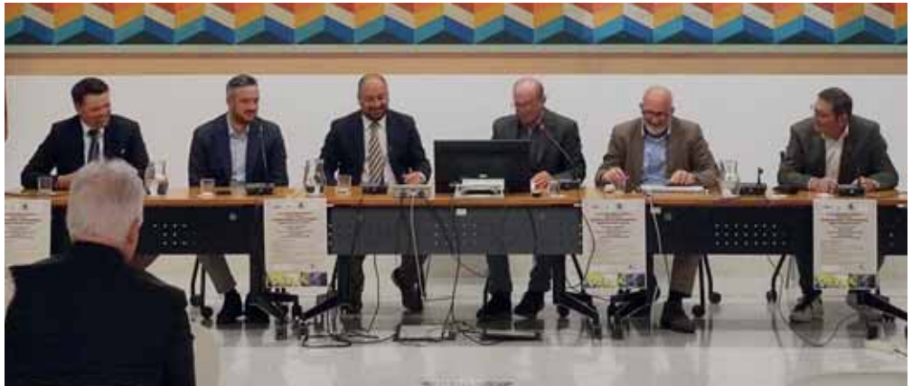
L'apprezzato convegno sulla flavescenza dorata ospitato in sala civica

È il caso della flavescenza dorata, oggetto del convegno che si è tenuto in sala civica XI Aprile 1848 lo scorso 28 aprile. La tematica è stata ampiamente illustrata e sono stati indicati nuovi possibili interventi a