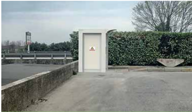
La collocazione della casetta dell'acqua a Cavalcaselle

Come l'altra, anche questa casetta utilizzerà un processo di microfiltrazione dell'acqua, mentre una speciale lampada a raggi ultravioletti ne garantirà la disinfe-