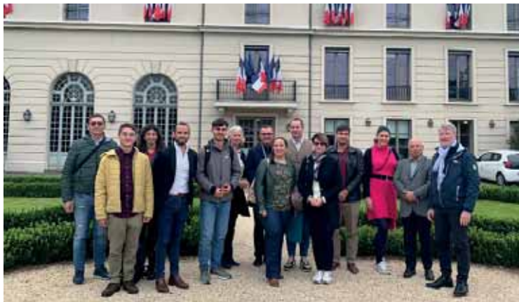
L'incontro con la municipalità di St. Germain en Laye

Per rendere maggiormente comprensibile questo importante progetto, il pranzo è stato organizzato presso un Centro di ritrovo, dove vengono quotidianamente preparati e serviti pasti gratuiti per persone in difficoltà. Abbiamo aiutato a cucinare piatti della tradizione africana, seguiti da volontari che dedicano ore di lavoro per offrire pasti caldi, nel rispetto delle diete tipiche delle varie etnie che frequentano il Centro. Nello spazio ricreativo vengono organizzate molte attività