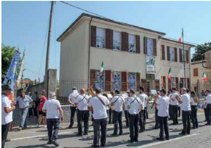
Lo spazio espositivo che accoglierà la Bandiera storica

Sicuramente il desiderio è di poter custodire il prezioso