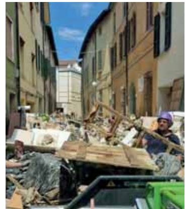
L'inaugurazione del soppalco e gli interventi dei volontari nelle zone colpite dall'alluvione in Emilia Romagna