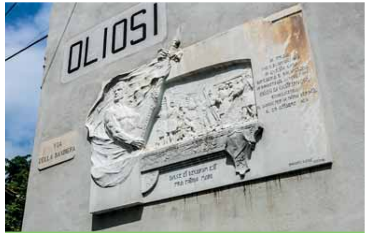
Il bassorilievo della "Casa Gloriosa"

Il 2 giugno al lido Campanello chi ha presenziato alla celebrazione della Festa della Repubblica ne è stato