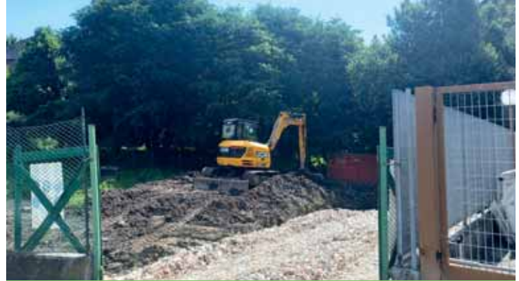
Iniziati lavori per il parcheggio accanto all'ufficio postale

I lavori sono già iniziati e la riqualificazione di quest'area centrale del paese potrà finalmente concretizzarsi.