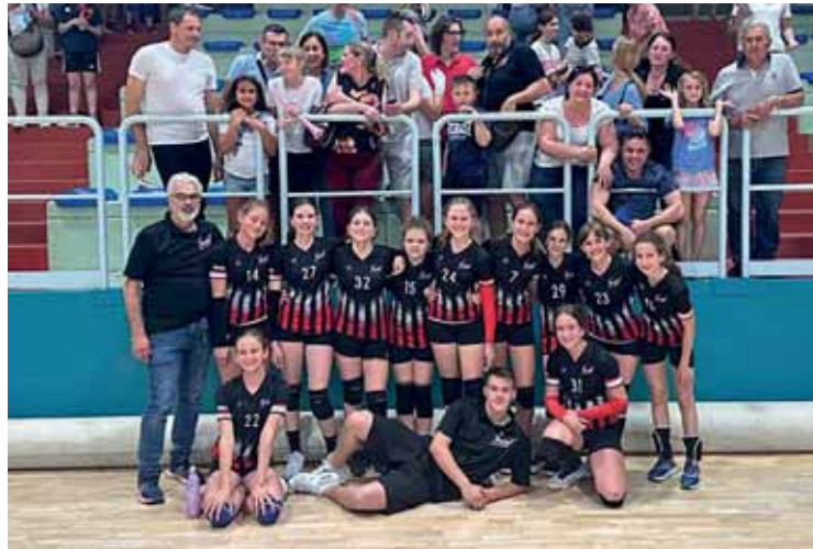
La squadra Under 12, campiona provinciale 2022/23

Poi le due squadre partecipanti al Campionato Under 12 3x3 sono andate alle finali e il gruppo di Minivolley S3, visti i successi ottenuti, si è guadagnato l'accesso alle finali regionali di Cittadella (Padova). E sono queste due compagini che poi hanno proseguito nel macinare risultati arrivando, con l'ex gruppo Under 12 a disputare le attuali finali Under 13 e, con l'ex gruppo Minivolley S3 a dominare il Campionato Under 12 ed a conquistare il titolo di Campioni provinciali in quel di Valeggio sul Mincio. Un ruolino di marcia invidiabile ed entusiasmante da parte