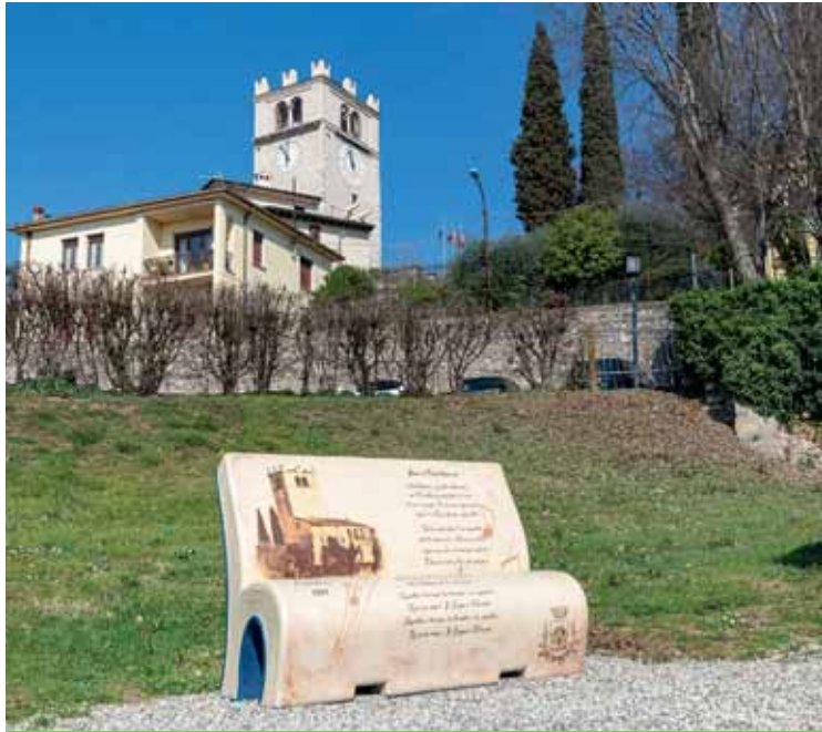
Il Brolo delle Melanie sarà attrezzato con giochi inclusivi

Parco giochi. Al Parco del Brolo delle Melanie c'è un gioco nuovo, un castello, che per materiali e decorazioni risulta molto impattante rispetto all'immagine proposta in sede di acquisto, inoltre le certificazioni obbligatorie sono state consegnate solamente il 23 maggio.