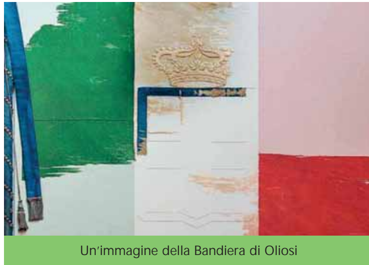
Un'immagine della Bandiera di Oliosì

Dividersi la responsabilità, fidarsi uno dell'altro, sperare e credere convintamente che solo con l'unione si possano raggiungere gli obiettivi fissati: questo il loro insegnamento. In una comunità ognuno si deve prendere una parte di responsabilità, si deve caricare il proprio peso, agire in unità per il senso di appartenenza che ci accomuna e