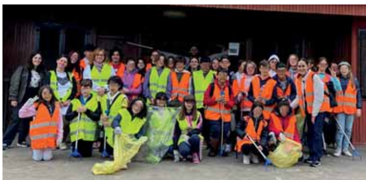
Il gruppo impegnato nelle operazioni di pulizia

Numerosi i ragazzi, dagli 11 ai 14 anni, che hanno partecipato con entusiasmo all'iniziativa accompagnati da alcune professoresses,