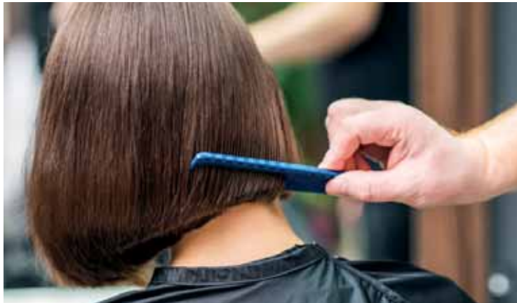
Le parrucchiere possono intercettare situazioni sospette

Nasce da questi presupposti il progetto "Sentinelle contro la Violenza" per