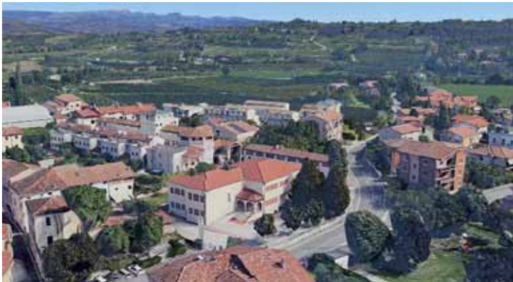
La scuola primaria di Sandra; in basso la scuola Manganotti

stati incaricati dei lavori, in modo da ottimizzare tempi di realizzazione e risolvere situazioni che ostacolavano l'avanzamento delle opere. In queste ultime settimane la Giunta e i vari consiglieri con deleghe hanno organizzato un piano di condivisione dei lavori e un coordinamento sistematico con gli uffici tecnici, modalità che consente un continuo aggiornamento sullo stato di avanzamento delle opere.