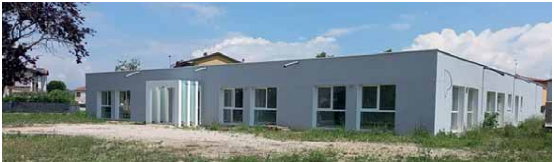
Lex asilo di Castelnuovo prima e dopo gli importanti interventi di ristrutturazione

Giovani in officina (illustrato più diffusamente in questo numero), fondamentale per stimolare il senso civico e la manualità agli adolescenti, che sempre più spesso soffrono la dipendenza da internet.