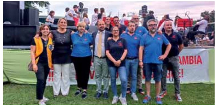
La conclusione dell'anno scolastico agli impianti sportivi

La consegna degli attestati è un momento importante per la vita della nostra comunità perché si svolge alla presenza delle associazioni di volontariato Fidas, Aido, Protezione civile e Croce Rossa . I nostri giovani hanno l'opportunità di ascoltare testimonianze e conoscere i principi ispiratori che muovono tanti volontari in opere di sostegno, solidarietà e dedizione verso il prossimo. Anche il Lions Club International Peschiera del Garda, Castelnuovo del Garda, Pastrengo e Lazise, è sempre presente con le premiazioni agli alunni che hanno aderito alla campagna "Poster per la Pace". Il concorso artistico di quest'anno scolastico era incentrato sul tema della Compassione, un tema importante che ha offerto agli alunni la possibilità di espre-