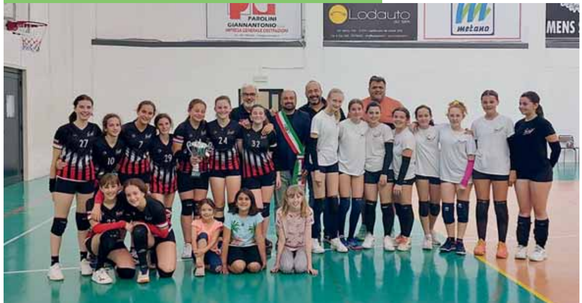
L'Under 12 con la squadra Under 13, semifinalista nel Campionato Primavera