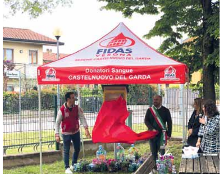
L'inaugurazione della casetta dei libri a Cavalcaselle