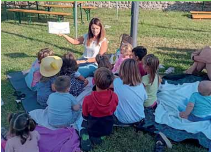
Letture per i più piccini alla Festa del libro al Brolo

ratura, con grandi nomi accanto ad astri nascenti del panorama lirico internazionale. Viene inoltre assegnato un premio prestigioso, lo scorso anno è stato assegnato al grande baritono Leo Nucci.