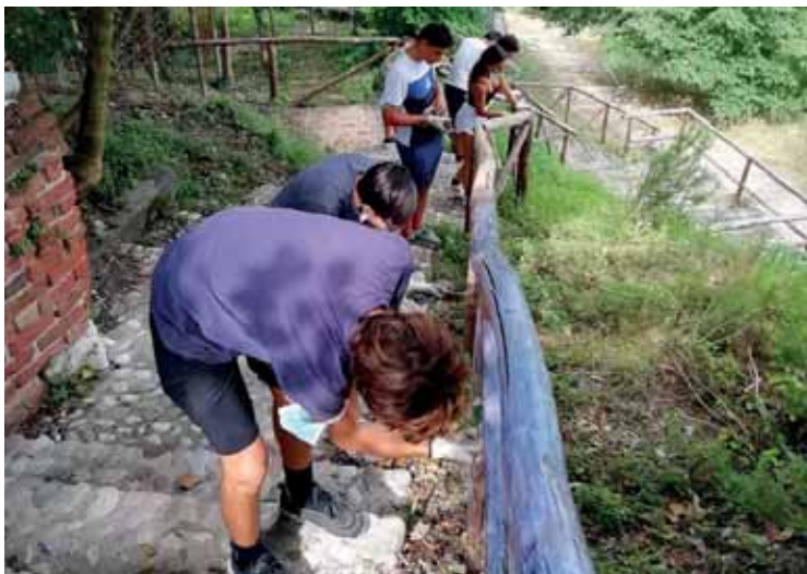
L'impegno dei ragazzi al campus occupazionale

Per quanto riguarda l'ambito sociale, si è cercato favorire l'incontro fra i bisogni espressi dalla cittadinanza