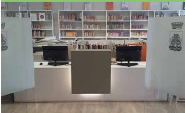
La nostra biblioteca gestisce oltre 14mila prestiti