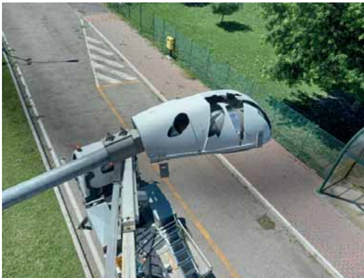
Lampione danneggiato dalla grandinata dell'estate scorsa

L'evento bellico avvenuto in Ucraina nel 2022 ha invece comportato l'esplosione dei costi energetici per almeno due anni, col raddoppio della bolletta energetica del Comune, anche questi solo in parte ristorati