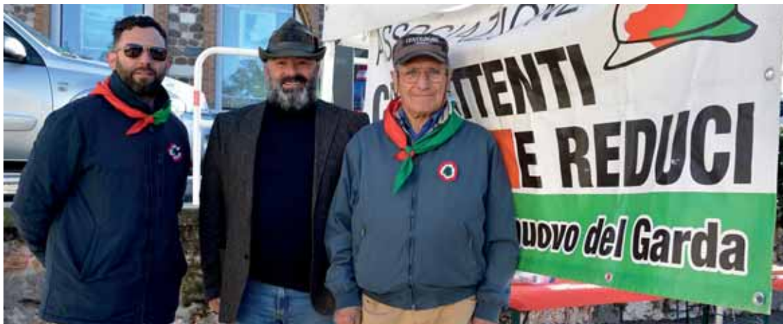
La stretta collaborazione con le associazioni ha permesso di arrivare a risultati importanti