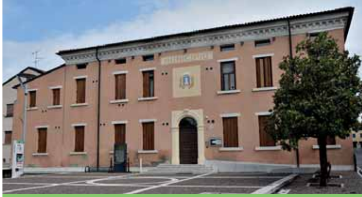
L'efficientamento energetico ha interessato anche il municipio

Grazie al Bando CSE 2022, promosso dal Ministero della Transizione Ecologica, il Comune ha ottenuto circa 800.000 euro di contributi per l'efficientamento energetico di alcuni immobili. Il bando offriva la possibilità di intervenire su un massimo di cinque edifici in ogni Comune: per Castelnuovo del Garda sono stati individuati il municipio, la scuola secondaria, la scuola primaria di Cavalcaselle, l'ex scuola di Oliosi e l'ex scuola elementare del capoluogo.