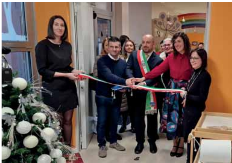
Il taglio del nastro del nuovo nido integrato

pareti interne con posa di nuove porte, la realizzazione degli intonaci e la tinteggiatura dei locali destinati al nido, con rifacimento completo di tutti gli impianti, oltre alla posa di una nuova pavimentazione certificata e la sostituzione dei serramenti esterni. L'intervento è stato completato dall'inserimento di nuovi arredi.