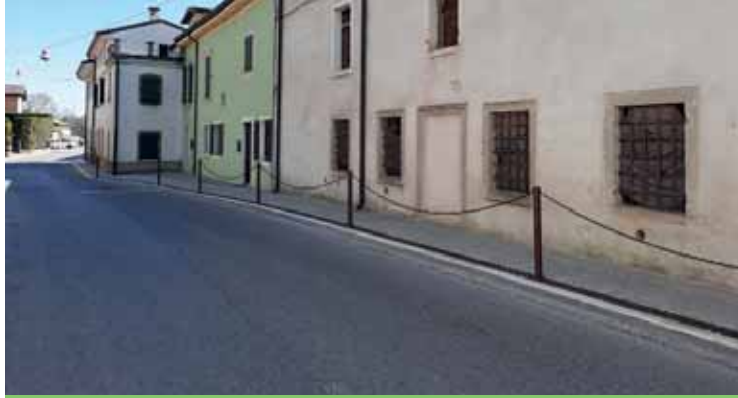
Il primo tratto realizzato del marciapiede in via Custoza

In partenza i lavori del secondo tratto del marciapiede in via Custoza a Oliosì. La via principale della frazione ha già beneficiato di un'apprezzabile riqualificazione al termine dei lavori del primo stralcio, che hanno portato un significativo miglioramento della sicurezza dei pedoni e alla limitazione della velocità di transito dei mezzi. Un'apposita rete di raccolta ha inoltre assicurato lo smaltimento delle acque meteoriche. Una volta completato il nuovo tratto di marciapiede, sarà possibile percorrere in completa sicurezza l'intera