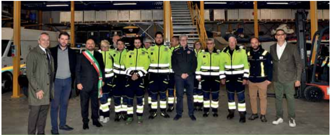
La Protezione civile di Castelnuovo del Garda opera da 40 anni e ha all'attivo 38 volontari

Nei tempi di pace però il gruppo si è impegnato a coinvolgere la popolazione, giovani in primis, grazie ad un progetto con la scuola secondaria di