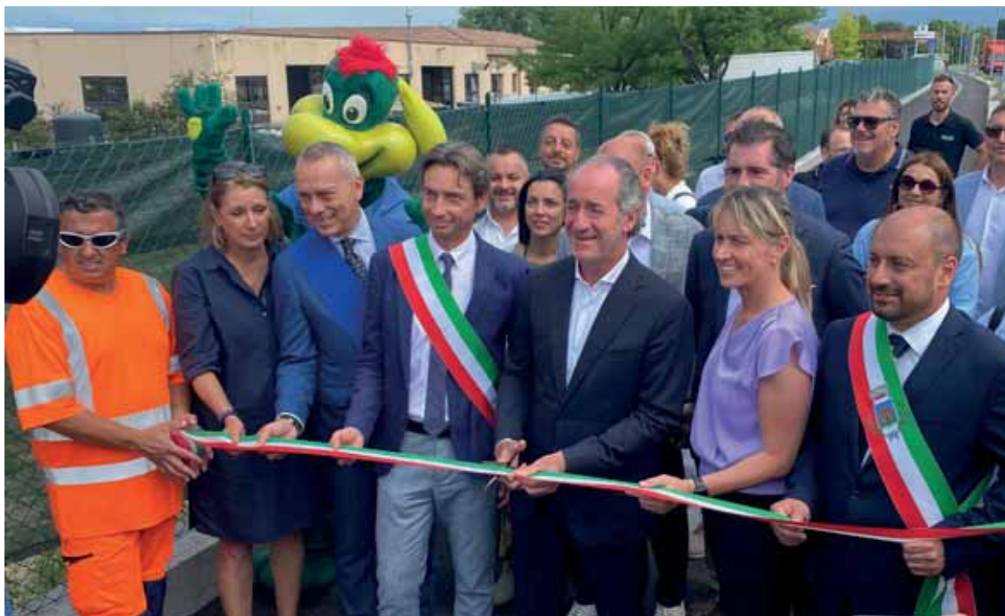
Inaugurazione del tratto della ciclovía del Garda nei Comuni di Castelnuovo del Garda e Lazise

re, edificio ormai fatiscente che grazie agli investimenti è diventato uno spazio espositivo dedicato alle guerre risorgimentali con la valorizzazione della storia locale legata alle guerre di indipendenza.