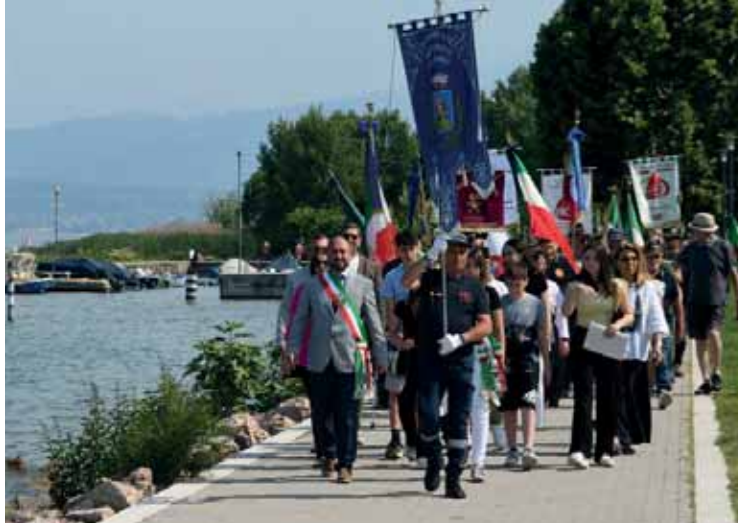
Il presidio del 2 giugno 2023 con i nostri ragazzi

Questa è realtà. Ora è importante progettare il futuro. A cominciare dalla realizzazione dello svincolo della SR 450 di entrata-