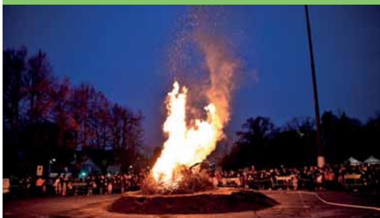
Il falò della Befana e, in basso, l'antica Fiera di Cavalcaselle

stazioni hanno avuto un salto di qualità e di visibilità attirando turisti e visitatori da alti Comuni e territori. Interessante la pianificazione di una serie di eventi legati all'enogastronomia regionale: Festa Sarda, Festa Siciliana e la Festa Pugliese.