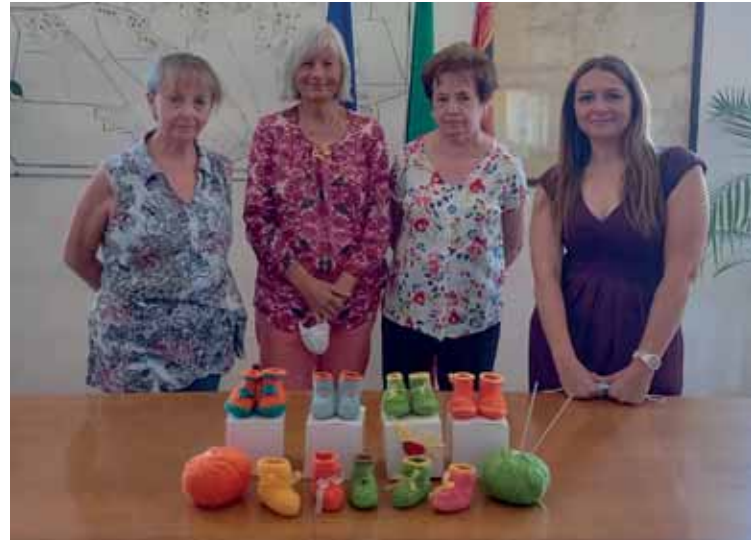
L'interno di Casa di Mamma e le babbucce di benvenuto realizzate dal gruppo Le Beflane. Sotto, i ragazzi della multiofficina

in collaborazione con l'ufficio Lavori pubblici del Comune. I ragazzi erano costantemente seguiti dagli educatori che li hanno condotti nello svolgimento delle diverse attività.