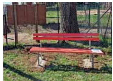
Le sei panchine rosse posizionate a Castelnuovo e nelle frazioni