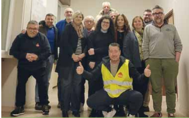
I volontari Aido sempre al servizio della comunità

Gazebi, gazebi e gazebi per raccogliere consensi e iscrizioni, pioggia presa tanta, freddo pure, e nel mentre è