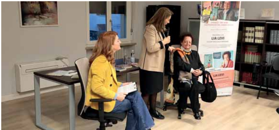
Il recente appassionante incontro con Lia Levi, scrittrice sopravvissuta all'Olocausto

Il lavoro in collaborazione tra ufficio tecnico, ditta specializzata nella tipologia di arredamento richiesto, assessore e bibliotecarie, ha favorito la realizzazione di un percorso tematico per la disposizione dei mobili, delle attrezzature e dei libri. Ora ci sono: un'area bimbi, un'area ragazzi, un'emeroteca, una sala gaming, una sala sagistica e una sala per studio e consultazione. Ci sono postazioni per computer e tavoli studio. Grazie anche ad alcuni sponsor, il risultato finale è che Castelnuovo ha una biblioteca funzionale, luminosa, ricca di libri ben suddivisi per genere letterario ed età, scaffalatu-