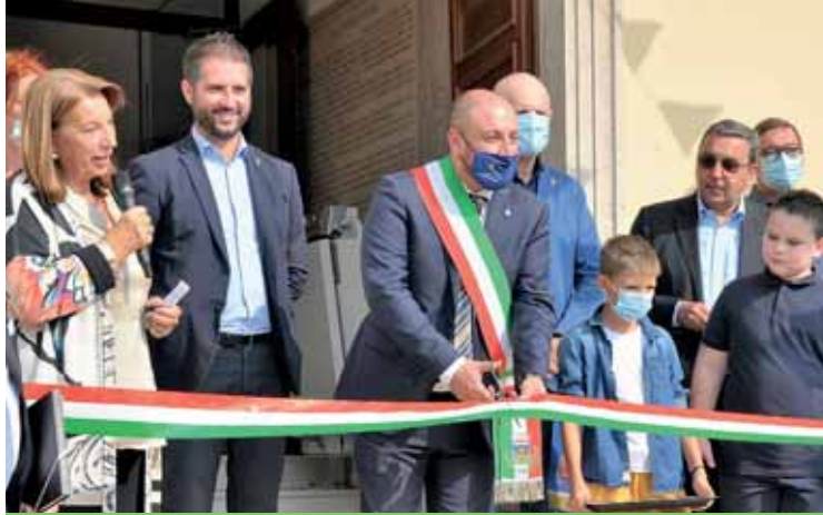
L'inaugurazione della biblioteca dopo la riqualificazione

Dopo l'abbattimento delle barriere architettoniche, il rifacimento dell'impianto elettrico, la posa di una nuova pavimentazione e la