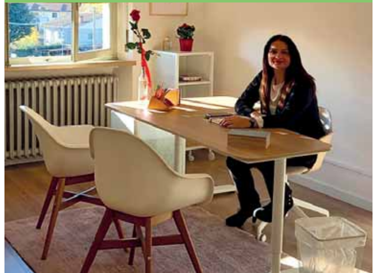
Lo Sportello antiviolenza in piazza Libertà