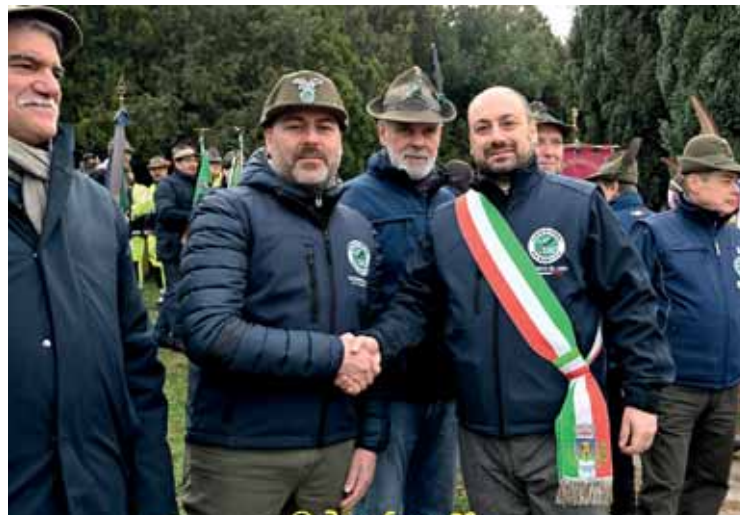
Sempre solido il legame con le Associazioni d'Arma