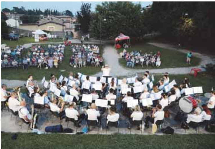
La Banda cittadina sempre presente e attiva