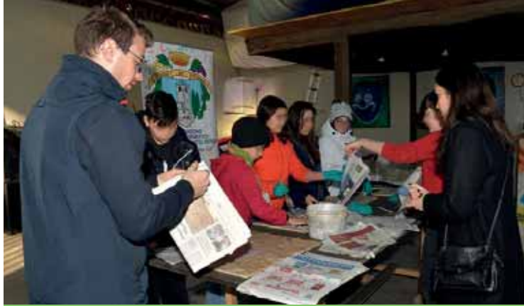
I ragazzi del CCR al lavoro all'Officina del Carnevale

Nel 2021 alcuni ragazzi sono stati coinvolti nel progetto Groove-Beneco , che ha visto la realizzazione di numerose iniziative in ambito ecologico, come Eco Walk, o passeggiata ecologica, che ha rappresentato un'occasione di ritrovo per i giovani con la raccolta dei rifiuti abbandonati sul nostro lungolago. Questa attività ha impegnato i