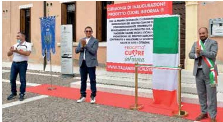
L'inaugurazione del defibrillatore davanti al municipio. In basso, la formazione della Protezione civile agli studenti

Da segnalare anche il potenziamento della