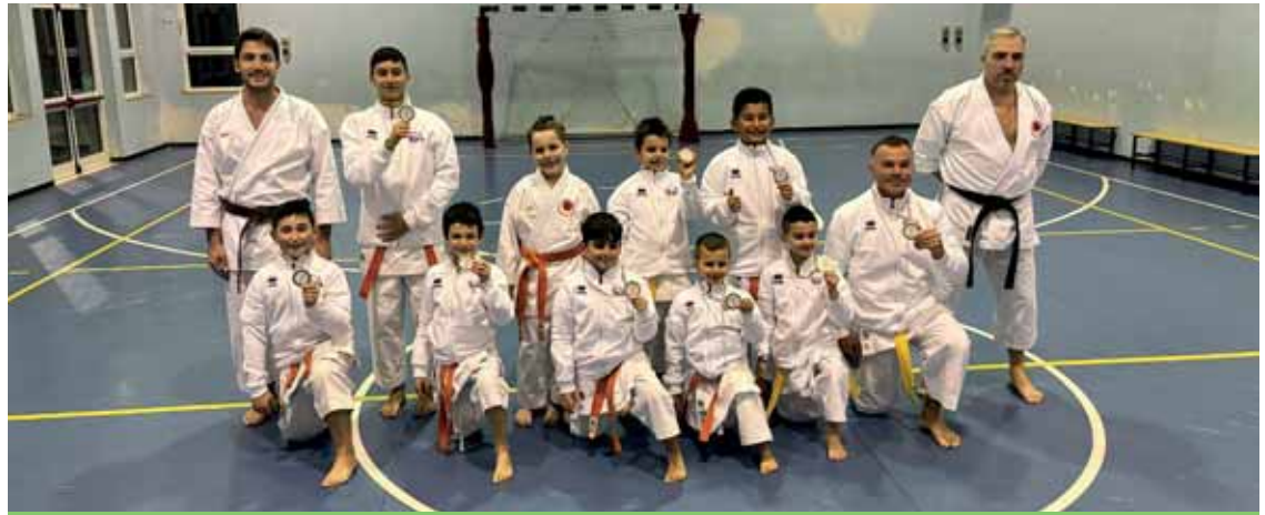
Gli atleti dell'Energy Academy Asd Karate Team con le ultime medaglie conquistate