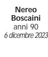
Nereo Boscaini anni 90 6 dicembre 2023