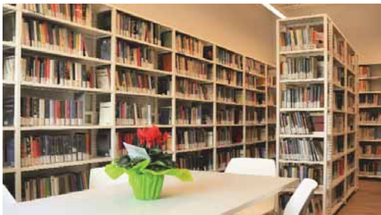
Gli utenti iscritti al prestito sono oltre 4mila

La nostra biblioteca è un centro di aggregazione sociale e culturale, siamo orgogliosi dei risultati raggiunti e ringraziamo le bravissime bibliotecarie e la cooperativa Charta per la costante e fattiva collaborazione con l'Amministrazione comunale.