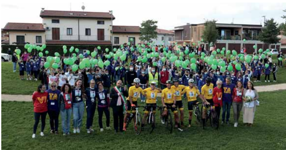
L'evento a sostegno della ricerca sulla fibrosi cistica che ha coinvolto centinaia di studenti

Tutti questi progetti sul futuro del nostro territorio sono frutto anche del costante e proficuo rappor-