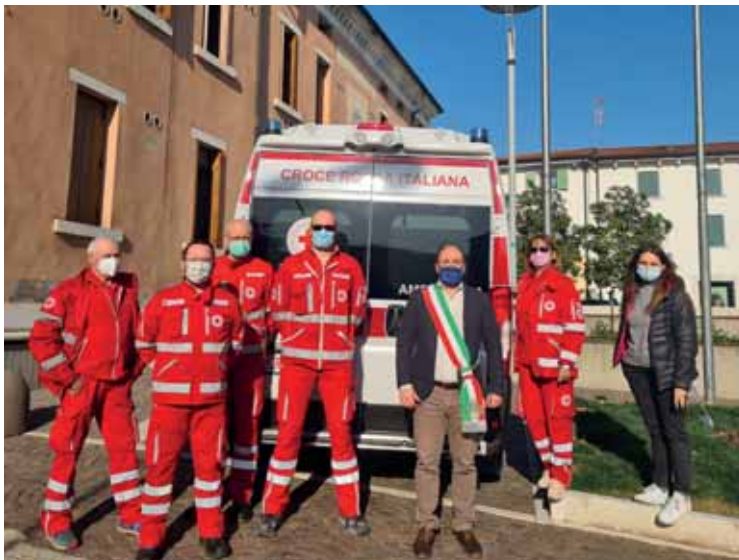
La collaborazione con Croce Rossa durante l'emergenza covid

Sono molte le persone che per ragioni di età o di salute si sono trovate nell'impossibilità di provvedere in autonomia all'approvvigionamento di farmaci. Per loro è stata organizzata la consegna dei medicinali a domicilio da parte delle