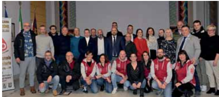
La presentazione del libro "100 anni di volontariato"

Collaborando con la Pro Loco cercando di fare una Festa dell'Uva che nessuno avrebbe minimamente pensato in quel momento, non mancando mai a sfilate per commemorazioni di ogni tipo e grado, donando alle scuole dosatori di gel igienizzante studiati per i ragazzi, consegnando ogni anno i nostri calendari all'Istituto comprensivo di Castelnuovo, cercando di non fare mancare Santa Lucia, la Befana e tutte