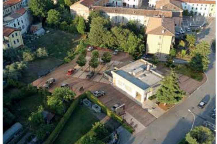
La nuova piazza delle poste a Castelnuovo

La spesa complessiva per la realizzazione della nuova piazza ammonta a 450.000 euro.