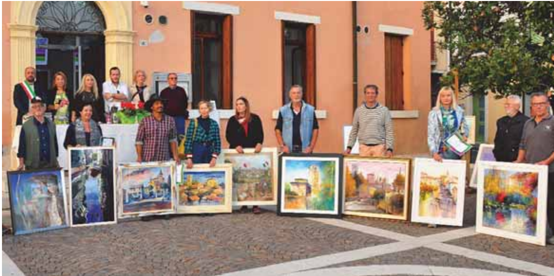
Il Concorso di pittura estemporanea ha richiamato artisti anche da fuori regione

attiva e propositiva nei vari corsi musicali che hanno favorito l'incremento del numero dei componenti. La nostra Banda è un punto di riferimento per quanti si avvicinano alla musica e desiderano imparare uno strumento entrando a far parte di un gruppo che conserva il valore di cultura e tradizione del territorio.