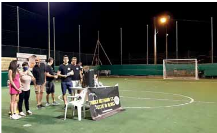
Il torneo notturno di calcio a 5 organizzato a Oliosì