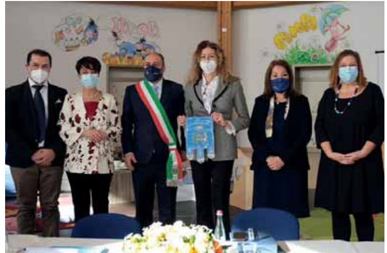
Il Sindaco Dal Cero con il Ministro del Turismo Garavaglia e a destra la visita del Ministro per le Disabilità Erika Stefani

to di collaborazione instaurato in questi ultimi anni con tutti gli enti di livello superiore, dall'Europa al Governo e dalla Regione alla Provincia, come con gli altri Comuni del territorio.