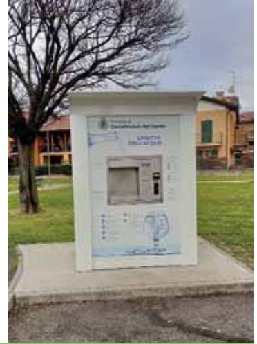
Le casette dell'acqua a Sandrà, Cavalcaselle e Castelnuovo. In fase di allestimento a Oliosi

una speciale lampada a raggi ultravioletti sottopone a disinfezione l'acqua prima dell'erogazione. Rifornirsi alle casette, oltre che conveniente, contribuisce a ridurre