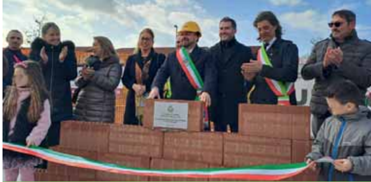
La posa della prima pietra della scuola primaria di Sandrà

«Posare la prima pietra di una scuola è aprire una finestra sul futuro di una comunità, perché il domani appartiene ai nostri bambini. È grazie a loro se possiamo guardare con fiducia all'avvenire del nostro terri-