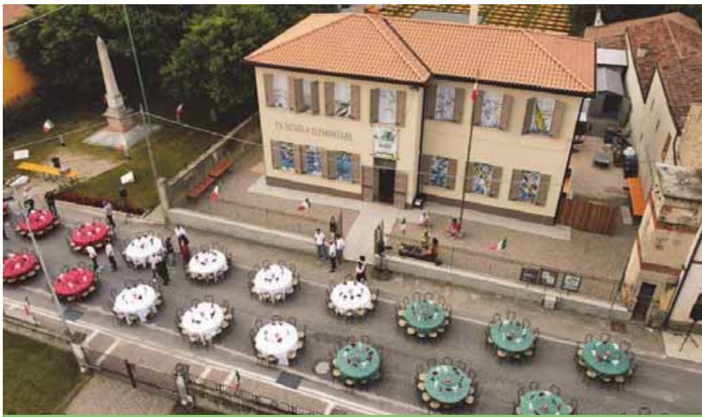
L'ex scuola elementare di Oliosì è divenuta una curata sede espositiva

Di fronte all'ex scuola è stata decorata una cabina Enel con il soggetto "Uomini contro", un pannello informativo sarà collocato in prossimità della Casa Gloriosa e sarà completata la Salita Villarey con la lapide dedicata ai bersaglieri. Altri pannelli informativi, con traduzioni in inglese e tedesco, saranno collocati lungo il tragitto e la rotonda di Oliosì verrà completata con un'installazione di figure in corten che identificheranno la frazione come luogo di eventi storici. Anche la zona adiacente la scuola è stata oggetto di intervento con la posa di due lapidi commemorative per i fratelli Speri e con dei gran-