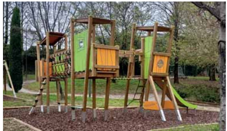
Il nuovo castello installato al parco del Brolo

Molti giochi acquistati sono inclusivi, perché ogni bambino deve poter accedere liberamente in sicurezza, non si tratta certamente di mere scelte cromatiche, ma si tratta di