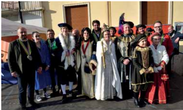
Maschere e sfilata dello scorso 25 febbraio

Il 27 febbraio 2021 l'associazione Carneval de Castelnuovo e la maschera ufficiale Duca Gian Galeazzo Visconti e Duchessa Caterina entrano ufficialmente nel Centro Coordinamento Maschere Italiane. Viene poi consegnata una targa al primo Duca