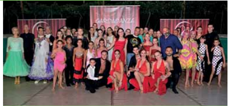
Un appuntamento estivo proposto a Oliosì

Importanti anche le collaborazioni in ambito sportivo. Il quotidiano lavoro delle associazioni sportive ha rappresentato una risorsa fondamentale per i giovani. Un progetto particolarmente significativo avviato nell'ultimo anno è stato "Luna-