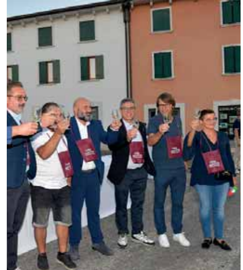
Immagini delle ultime edizioni della Festa di San Lorenzo e della Festa dell'Uva

rio, come la Festa dell'Uva/Festival o di San Lorenzo a Cavalcaselle, sono state organizzate durante il covid, ovviamente con le dovute precauzioni e il rispetto delle disposizioni in materia di sicurezza e igiene.