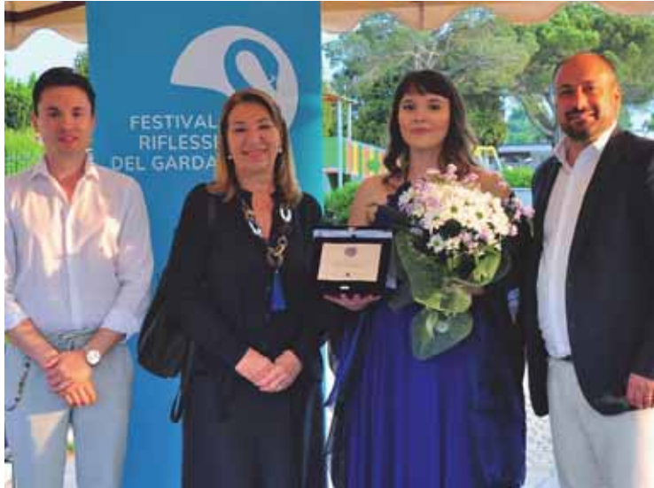
La rassegna Riflessi del Garda al lido Campanello

Le serate dedicate al Giorno della Memoria e a temi di grande attualità sono stati sempre accolti da un pub-