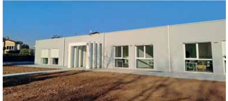
Lo stato di abbandono in cui versava l'ex scuola dell'infanzia e, a destra, la trasformazione nella nuova sede comunale

Operativa la nuova sede comunale di via Marco Polo 30, ricavata nell'ex scuola dell'infanzia di Castelnuovo, da diversi anni in stato di abbandono ed ora completamente riqualificata.