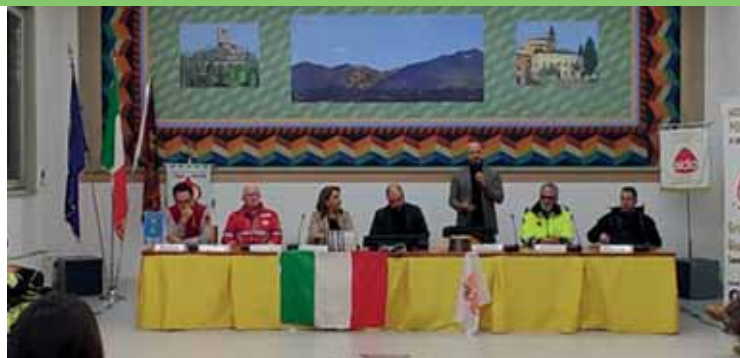
Il tavolo dei relatori alla serata dedicata ai nostri giovani