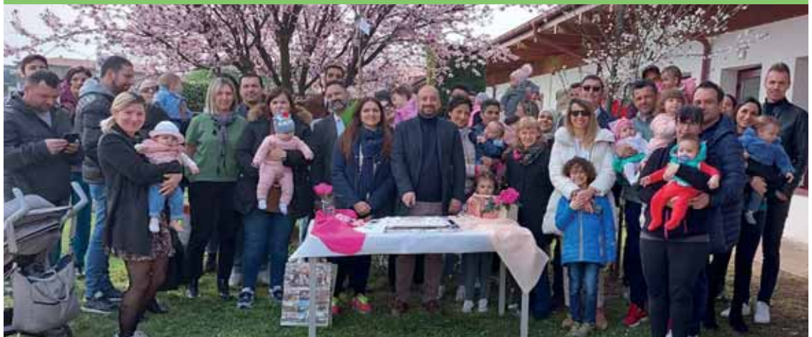
Il secondo appuntamento all'asilo Castelfiorito di Castelnuovo