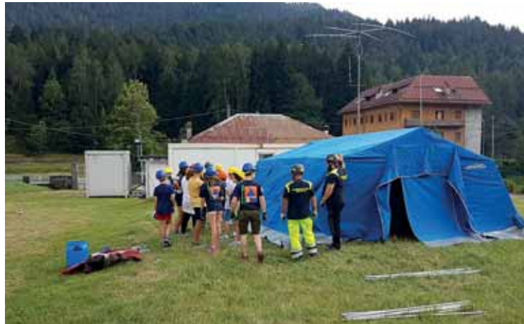
Ragazzi a un'esercitazione di Protezione civile

Il campo inizierà domenica 18 giugno e si concluderà domenica 25 giugno. Si svolgerà presso la sede della Squadra Volontari Castelnuovo del Garda ODV, in via Galileo Galilei 20 a Castelnuovo del Garda, ed è aperto a tutti, ragazzi e ragazze. Durante la settimana i ragazzi avranno la possibilità di scoprire quali sono le attività che ogni giorno deve affrontare la Protezione civile, cosa significa