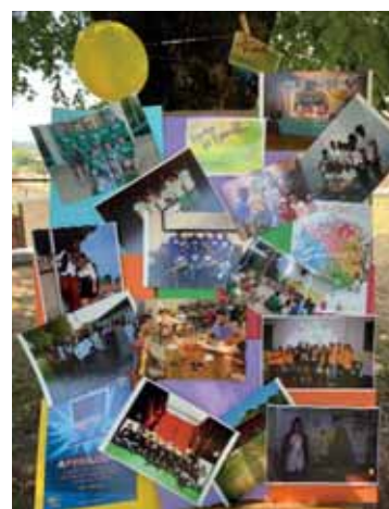
Un collage degli incontri

Gli incontri, aperti ai giocatori di ogni età, a partire dalla scuola primaria, proseguiranno anche nei prossimi mesi, per dare ai nostri