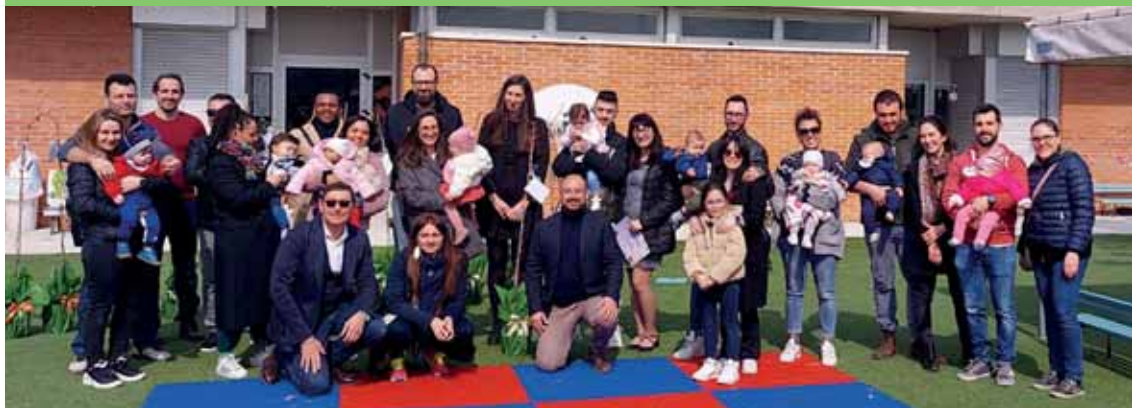
Conclusione con il gruppo di famiglie alla scuola dell'infanzia di Cavalcaselle

da 0 a 3 anni. La cerimonia è stata organizzata in collaborazione con Croce Rossa Italiana - Comitato Basso Garda Veronese e le associazioni