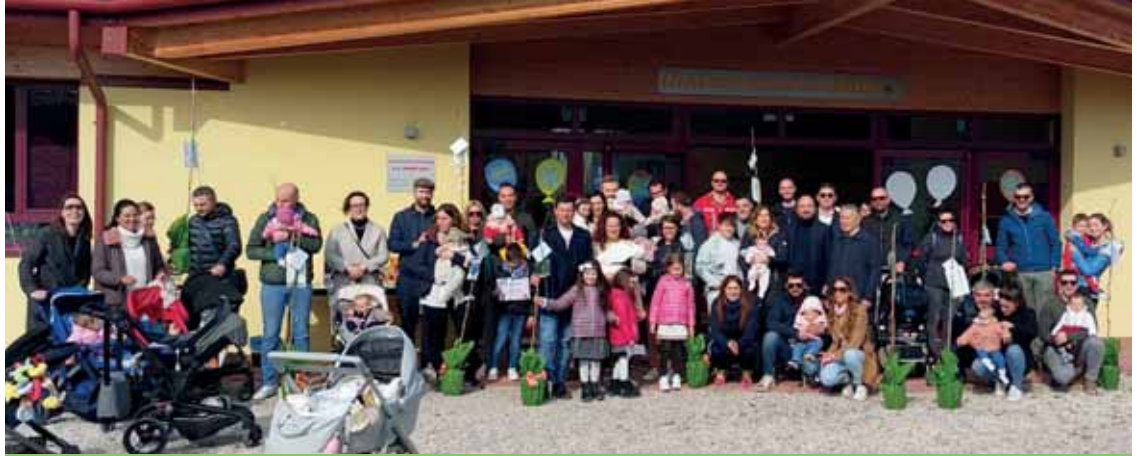
La tappa di apertura della cerimonia alla scuola dell'infanzia di Sandrà