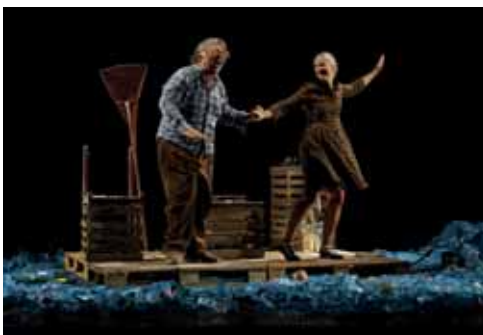
L'ultima primavera silenziosa

Sono stati organizzati 7 appuntamenti mattutini per le scuole, che hanno riscosso un grande successo, con la partecipazione anche di scuole fuori dal nostro Comune. Circa 2.700 alunni hanno assistito agli spettacoli. Offerti a titolo gratuito 3 spettacoli