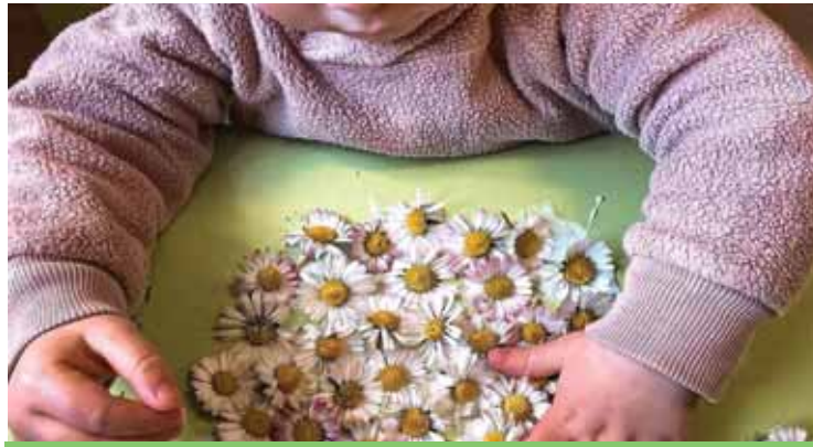
Sabato 27 maggio famiglie e bambini festeggeranno insieme il traguardo de "La Pigotta"

Un ringraziamento doveroso va all'Amministrazione comunale che fin dal 2003 ci ha sempre sostenuti in quanto pionieri di questo tipo di servizio offerto alle famiglie. Inizialmente ha stabilito una convenzione per i bambini residenti nella zona, e nel tempo ha continuato a dedicarci altre forme di sostegno per premiare il nostro forte radicamento nel territorio. La forza de "La Pigotta" , oltre alle idee educative ed innovative, è da individuare proprio nell'intreccio attivo e costante con il territorio, attraverso progetti straordinari favoriti anche dalla posizione strategica nel cuore storico del Comune. Basti pensare al