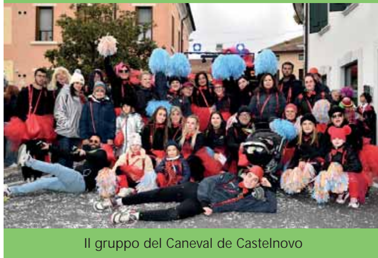
Il gruppo del Carneval de Castelnuovo