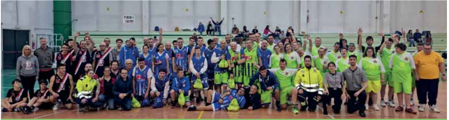
Il festoso gruppo dei partecipanti all'evento ospitato al palazzetto dello sport di Castelnuovo