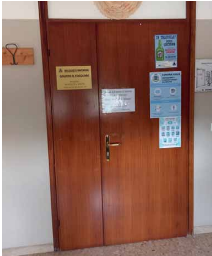
La sede dell'associazione "Il Focolare" a Castelnuovo

«Il gruppo ha cambiato la mia vita» dicono in molti. A tale proposito è davvero intensa e commovente la testimonianza di un com-