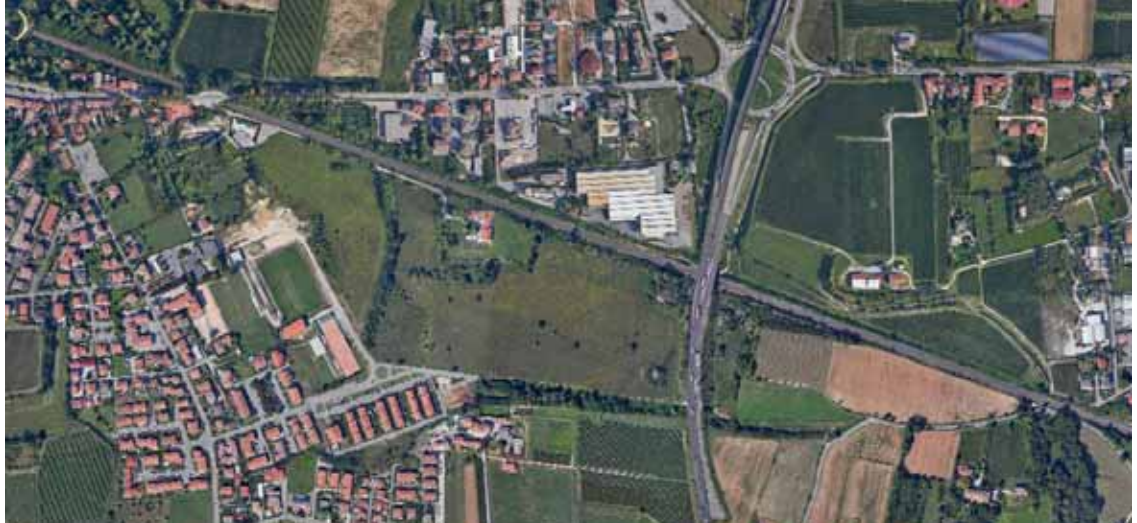
Viabilità e sicurezza sono strettamente correlate nel garantire l'accessibilità del territorio

di vigilanza privata dei nostri tre lidi che avrà inizio già dai fine settimana di aprile e si protrarrà per tutta la stagione.