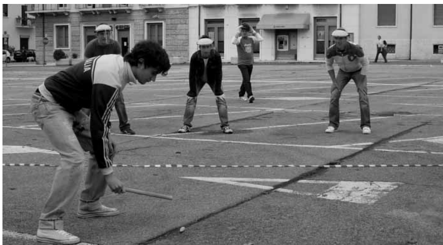
foto). Anche se il cattivo tempo ha complicato non poco l'organizzazione, possiamo ritenerci soddisfatti. Persone di tutte le età si sono infatti divertite assistendo alla rievocazione di un gioco del nostro passato.

Da sottolineare come iniziativa pienamente riuscita è il torneo di s-cianco che abbiamo proposto nello scorso settembre (nella