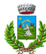
Comune di San Pietro in Cariano